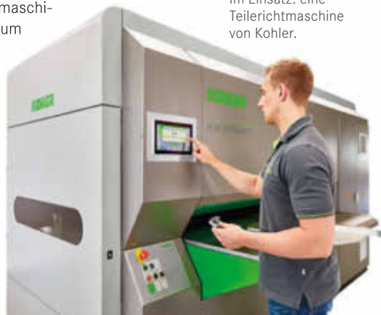
Im Einsatz: eine Teilerichtmaschine von Kohler.

Branchen setzen Richtmaschinen von Kohler ein – zum Beispiel ein Schweizer Metallflugzeugbauer, die Pilatus Flugzeugwerke AG, und Cendres + Métaux SA, ein Schweizer Zulieferer für die Uhren- und Schmuckindustrie, der für seine Kunden Edelmetalle richtet. mae