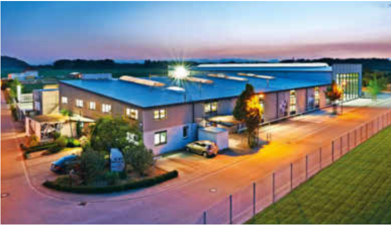
Das Gebäude der Belle AG in Wyhl, ganz rechts die neue Halle.

Das Unternehmen beschäftigt circa 70 hochqualifizierte Mitarbeiter – Ingenieure, Techniker, Meister, Stahlbauarbeiter, technische Zeichner und Kaufleute. Belle führt alle Arbeiten, von der Auftragsannahme über die Konzeption verschiedener Stahl- und Schweißkonstruktionen mittels CAD und die Herstellung der Komponenten bis hin zur Lieferung und Montage mit dem eigenen Team aus. Circa 15 der 70 Mitarbeiter sind in Ausbildung. Die Firma tut viel, um ihren Nachwuchs zu gewinnen, unter anderem über ein starkes Engagement in Sportvereinen und Schulen. So hat sie beispielsweise in der örtlichen Schule zusammen mit Schülern der oberen Klassen einen Fahrradstand gebaut. Der Umsatz der Belle AG hat sich während der vergangenen Jahre stetig erhöht und lag 2016 bei circa 7,5 Millionen Euro. orn