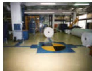
Burda Druck GmbH in 77652 Offenburg

77656 Offenburg-Elgersweier Carl-Zeiss-Str. 18 Tel. 07 81 / 60 59 - 0, Fax 60 59 - 60 Internet: www.storz-fussbodenbau.de E-mail: info@storz-fussbodenbau.de