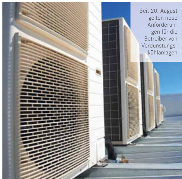
Seit 20. August gelten neue Anforderungen für die Betreiber von Verdunstungskühlanlagen