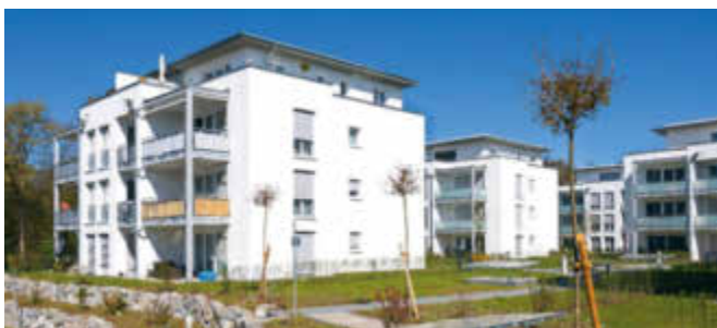
Diese Gebäude in der Gottenheimer Straße in Umkirch gehören zu den jüngst abgeschlossenen Neubauprojekten des Bauvereins Breisgau.

Die Sparkasse Freiburg-Nördlicher Breisgau schließt bis Jahresende 5 ihrer 52 Geschäftsstellen. Wie das Unternehmen mitteilte, sind die Filialen in Günterstal, am Basler Tor, am Friedrich-Ebert-Platz, in Munzingen sowie in Hochdorf betroffen. In Opfingen werden die Öffnungszeiten reduziert. Als Grund werden die veränderten Kundenbedürfnisse genannt.