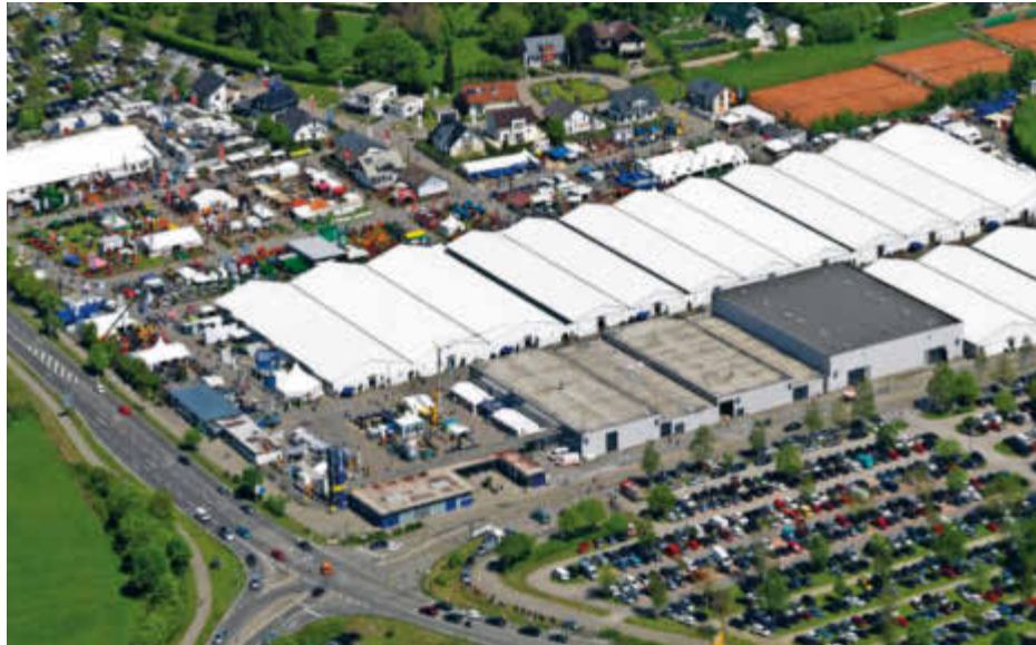
Das Messegelände Villingen-Schwenningen mit der Südwest Messe.

In Villingen-Schwenningen ist das Messegroßereignis die aus der „Südwest stellt aus“ hervorgegangene Mehrbranchen-„Südwest Messe“, die das gesamte Messegelände belegt (Bild) und seit Jahren stets über 100.000 Besucher verzeichnet. In diesem Jahr strömten an den neun Veranstaltungstagen im Juni rund 101.500 Besucher zu den 710 Ausstellern. Die SMA ist ihrem Messekonzept stets treu geblieben. Während auf anderen Messeplätzen oft einzelne Themen aus den traditionellen großen Verbrauchermessen in zeitlich getrennte Eigenveranstaltungen ausgegliedert wurden, gilt für die Südwest Messe nach wie vor das Prinzip: Handel, Handwerk und Gewerbe bis Land- und