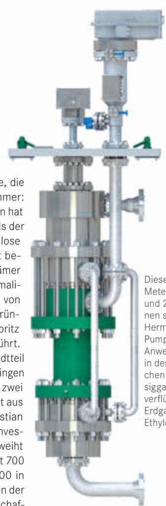
Diese 6,20 Meter hohe und 20 Tonnen schwere Hermetic-Pumpe dient Anwendungen in den Bereichen Flüssiggas und verflüssigtes Erdgas sowie Ethylen.