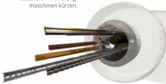
Eine Alternative zum Sägen: Metallstäbe unterschiedlicher Profile lassen sich mit Ablängmaschinen kürzen.