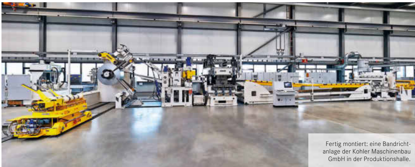
Fertig montiert: eine Bandrichtanlage der Kohler Maschinenbau GmbH in der Produktionshalle.