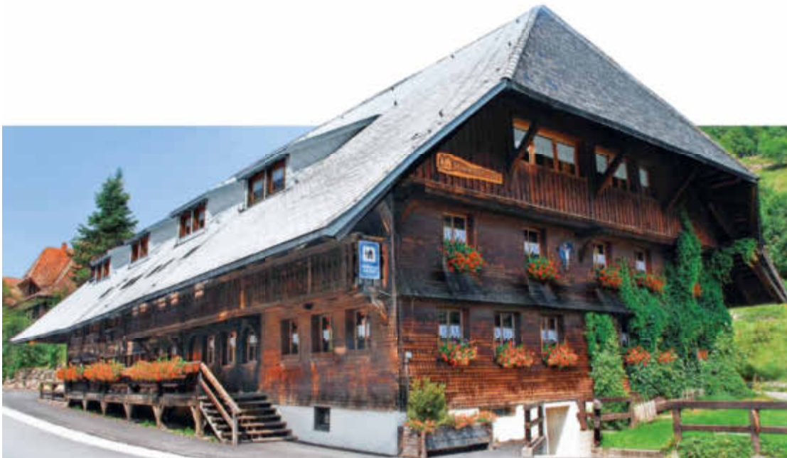
Die Jugendherberge in Menzenschwand wird von den Stadtwerken Müllheim Staufen mit Strom und Gas beliefert – wie auch alle anderen Jugendherbergen im Land.