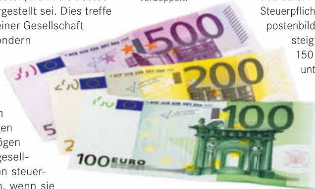
Die Grenze für Sofortabschreibungen hat sich von 410 auf 800 Euro nahezu verdoppelt.